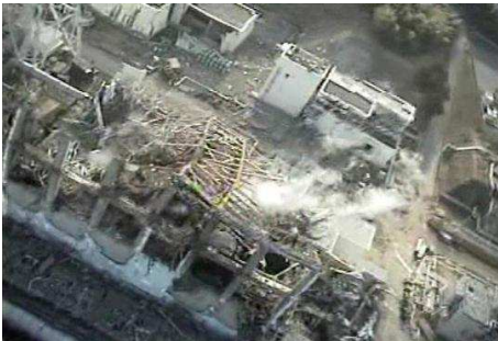
Le réacteur n°3 de la centrale de Fukushima

Une association indépendante de surveillance de la radioactivité (la Criirad) affirme que le nuage de Fukushima est arrivé en France deux jours avant la date annoncée. Elle souligne également que la radioactivité était supérieure à celle annoncée.